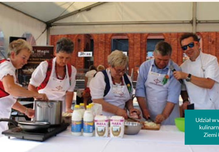
Udział w warsztatach kulinarnych Smaki Ziemi Łódzkiej