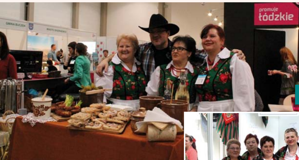
Udział w targach turystycznych